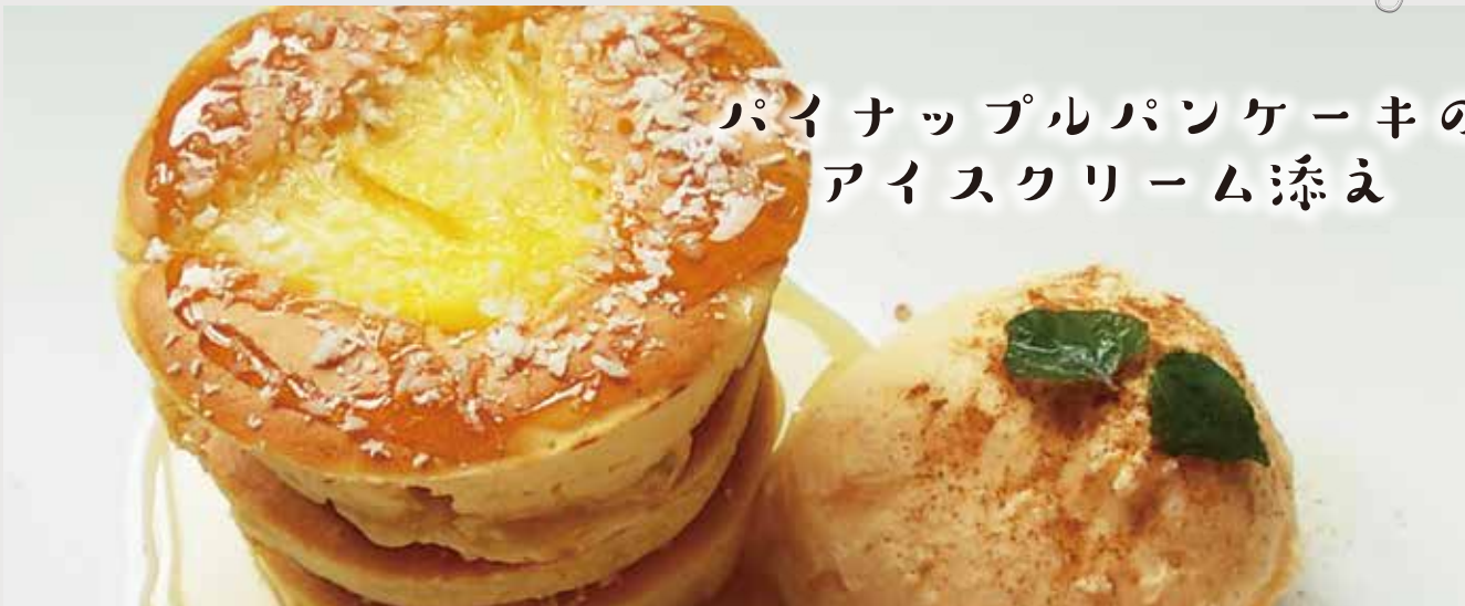
パイナップルパンケーキの アイスクリーム添え