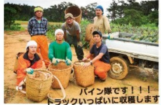
パイン隊です！！ トラックいっぱい収穫します！

東京ドーム15個分の面積があり、パイン・マンゴーの栽培が行われています。農場内には小さな加工所があり、採れたての果実を使った加工品・ドリンクやお菓子なども作っています。また、ご予約頂ければ、トラクタートレインに揺られ、農場内を見学することもできます！時期により、スナックパインやピーチパインなどパイナップルの収穫体験も出来ます。(こちらも要予約！)